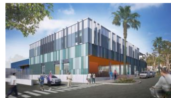
Inglewood Senior Center

Una instalación comunitaria de $27 millones, 35,000 pies cuadrados, de dos pisos con varias actividades relacionadas con personas mayores, servicios y estacionamiento subterráneo.