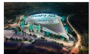
SoFi Stadium/Hollywood Park

Cuando se complete, el proyecto incluirá un estadio de la NFL de 70,000 asientos (expandible hasta 100,000 asientos) que albergará a los LA Rams y los LA Chargers, un lugar de actuación de 6,000 asientos, un pueblo minorista y un escaparate de moda, un pueblo de oficinas Clase A, unidades residenciales, un hotel de 300 habitaciones, lagos y parques.