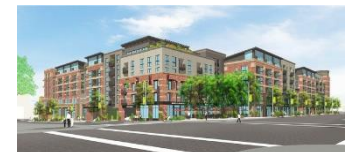
Market Gateway Apartments

A development agreement to build a mixed use, grocery-anchored rental housing development has been approved. The development is expected to begin construction in 2019.