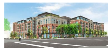
Market Gateway Apartments

Un hotel de seis pisos y 120 habitaciones. Incluye una terraza en la azotea con jacuzzi y chimeneas al aire libre, exuberantes jardines al aire libre en toda la propiedad, con instalaciones de arte público aprobadas por Planning.