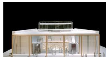
LA Phil's YOLA Center

Se ha aprobado un acuerdo de desarrollo para construir un desarrollo de viviendas de alquiler de uso mixto, anclado en supermercados. Se espera que el desarrollo comience a construirse en 2019.