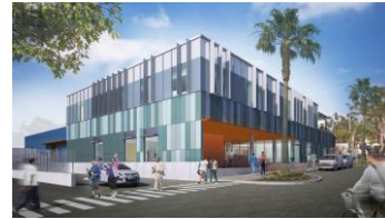
Inglewood Senior Center

A $27 million, 35,000 square-foot, two-story community facility with various senior-related activities, amenities and underground parking.