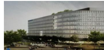
NFL Media Building

The NFL is occupying 177,000 square feet of a 453,000-square-foot facility to house its NFL Network, NFL.com, the NFL app and NFL RedZone within the Hollywood Park development.