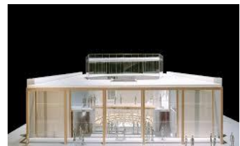
LA Phil's YOLA Center

The Los Angeles Philharmonic is building a 25,000 square-foot headquarters for its Youth Orchestra designed by renowned architect, Frank Gehry. The facility will accommodate after-school instruction, rehearsals, practice and performances.