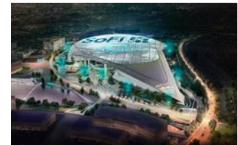
SoFi Stadium/Hollywood Park

When completed, the project will include an 70,000-seat NFL stadium (expandable up to 100,000 seats) that will house the LA Rams and the LA Chargers, a 6,000-seat performance venue, a retail village and fashion showcase, a Class A Office village, residential units, a 300-room hotel, water features and parks.